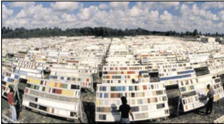
Speziell entwickelte Testtafeln am Aufstellungsort „Atlas Weathering Services Group“ in Florida, USA.

Scott Baders Entwicklungsprogramm stellt sicher, dass alle neuen Gelcoats unter extremsten Bedingungen getestet werden, auch in einer 12 Monate nach Süden gerichteten Aussetzung in Florida. Unter diesen extremen Bedingungen zeigen die auf Epoxid haftenden Crystic Gelcoats die hohe UV-Beständigkeit und Haltbarkeit eines Polyesterharzsystems für den Außenbereich.