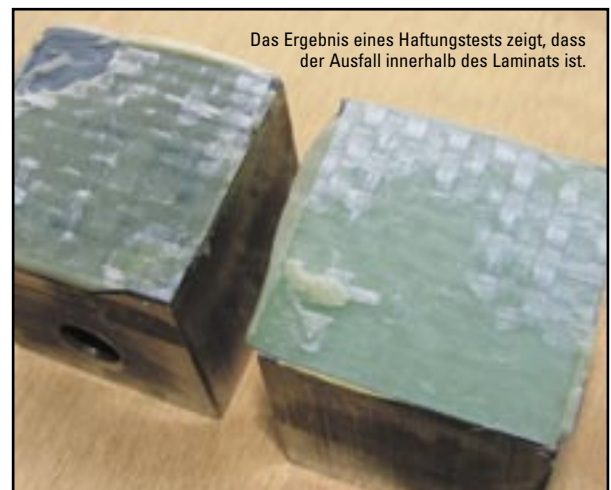
Das Ergebnis eines Haftungstests zeigt, dass der Ausfall innerhalb des Laminats ist.